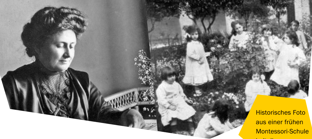
Historisches Foto aus einer frühen Montessori-Schule in Italien.